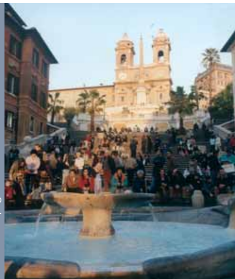
Piazza di Spagna