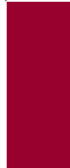
Piazza San Pietro