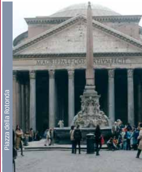
Piazza della Rotonda

San Lorenzo in Lucina, un arrêt hors du temps