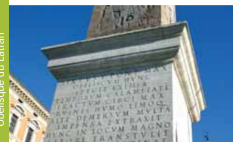
Obélisque du Latran

la statue de Marc Aurèle – considérée de façon erronée comme statue de Constantin et déplacée au Capitole.