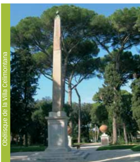
Obélisque de la Villa Celimontana

Obélisque du Latran. Situé Piazza San Giovanni in Laterano, c'est l'obélisque le plus ancien et le plus haut de Rome (32,18 mètres; 45,70 mètres avec la base et la croix). Il fut réalisé en un seul bloc de porphyre sur ordre du pharaon Thoutmôsis III (XV e siècle av. J.-C.). A l'origine, il se trouvait dans le temple d'Amon à Thèbes (Karnak), en Egypte. Apporté à Rome par l'empereur Constance II en 357 et initialement placé dans le Cirque maxime, il doit son emplacement actuel à Sixte V, qui chargea Domenico Fontana de l'ériger à Saint-Jean-de-Latran à la place de