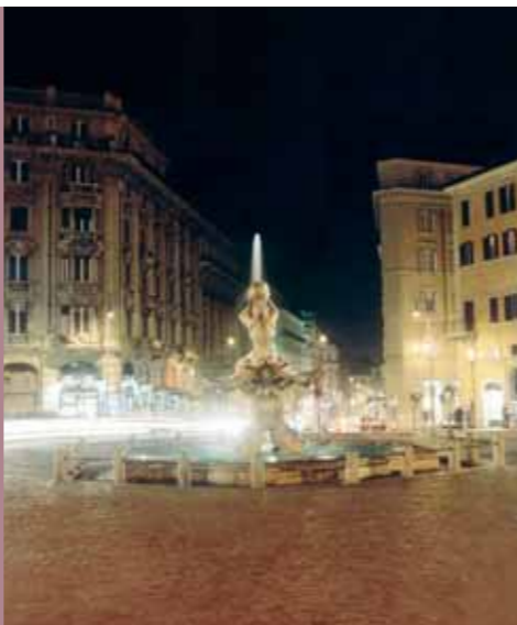
Fontana del Tritone

Desde la Piazza Barberini, tomamos Via Sistina para llegar a la Trinità dei Monti. A los pies de la escalinata podéis admi-