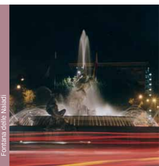
Fontana delle Naiadi