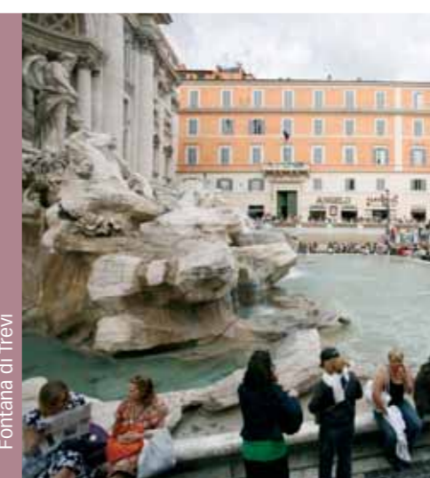
Fontana di Trevi

Regresando hacia Via del Tritone, es obligada una parada en la fuente que la película “La Dolce Vita” ha catapultado a una especie de imaginario colectivo inmortal: la Fuente de Trevi. Construida como celebración monumental del Agua Virgen, el agua traída a Roma a través del acueducto realizado por Agripa en el año 19 a. de C., esta fuente ha sufrido infinidad de remodelaciones y sustituciones a lo largo de los siglos. Provoca un efecto de sorpresa y maravilla por su imponente estructura, que parece “llenar” la plazuela entera. Una vez aquí no puede faltar la costumbre de lanzar al agua, de espaldas, una moneda: con este gesto os aseguráis volver a Roma algún día.