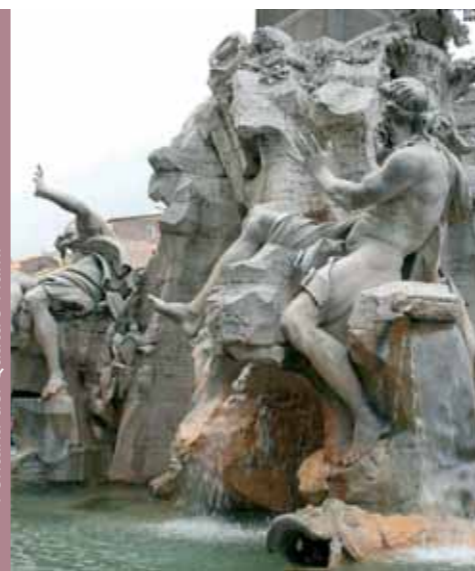
Fontana dei Quattro Fiumi