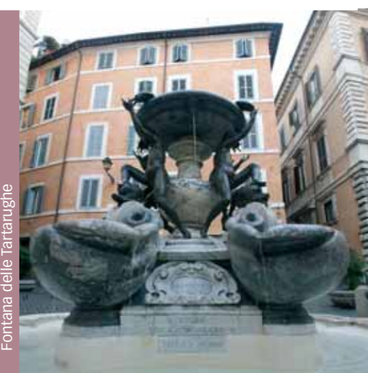
Fontana delle Tartarughe

Una vez en la Piazza Mattei, elegida varias veces en el pasado como plató cinematográfico natural, aprovechad para pasear por el gueto y saborear los platos de la tradición judía en uno de sus múltiples locales.