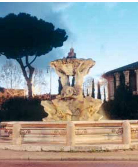
Fontana dei Tritoni