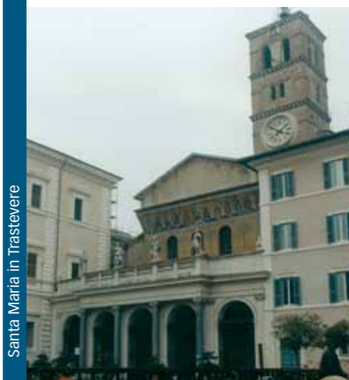
Santa Maria in Trastevere

Les nombreuses églises de Rome et leurs trésors cachés