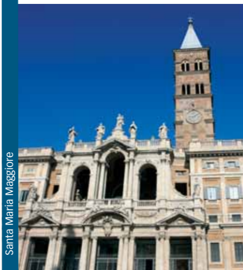
Santa Maria Maggiore