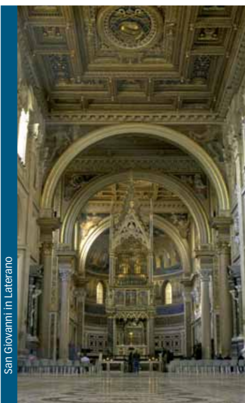
San Giovanni in Laterano