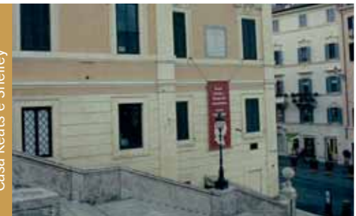
Casa Keats e Shelley

Le grand tour d'Europe, rêve des jeunes aristocrates