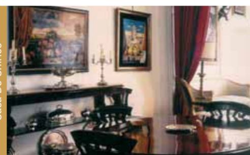
Casa De Chirico

"...Connais-tu le pays où fleurissent les citronniers?"