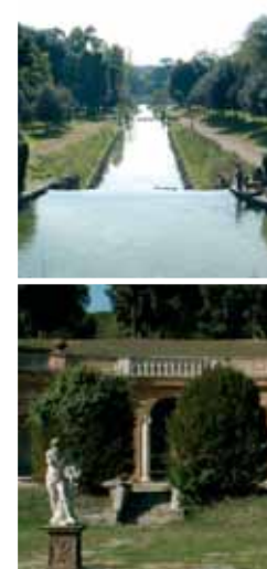
Casa del Cinema