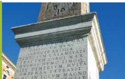
Obelisco de Letrán

en la época de Domiciano; no tiene jeroglíficos, el monolito estaba colocado originalmente delante del mausoleo de Augusto en Campo Marzio junto al otro obelisco que se encuentra hoy en la Piazza del Quirinale. Fue encontrado en las cercanías de Vía Ripetta sepultado y fracturado en varias partes.