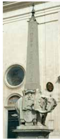
Obelisco di Piazza del Pantheon