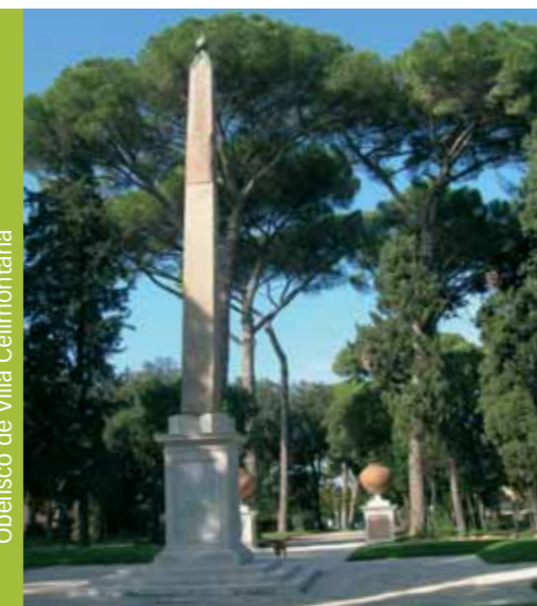
Obelisco de Villa Celimontana

Obelisco Esquilino. Se encuentra en la Piazza dell'Esquilino y es el segundo obelisco erigido en Roma por el Papa Sixto V, tiene una altura de 25,50 metros y fue realizado probablemente