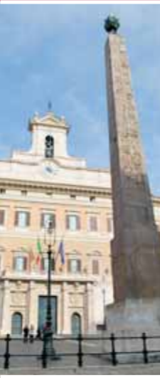
Trinità dei Monti

Imponentes construcciones, "trasladadas" varias veces en el curso de los siglos