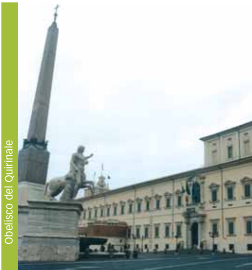
Obelisco del Quirinale