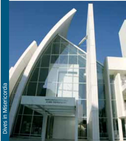
Dives in Misericordia

Zeitlose Meisterwerke und neue Architektur