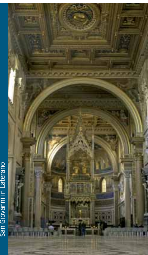
San Giovanni in Laterano