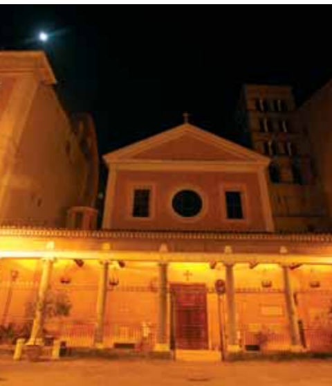
San Lorenzo in Lucina

Große „Namen“ für die römischen Sakralbauten: Michelangelo, Bernini, Caravaggio