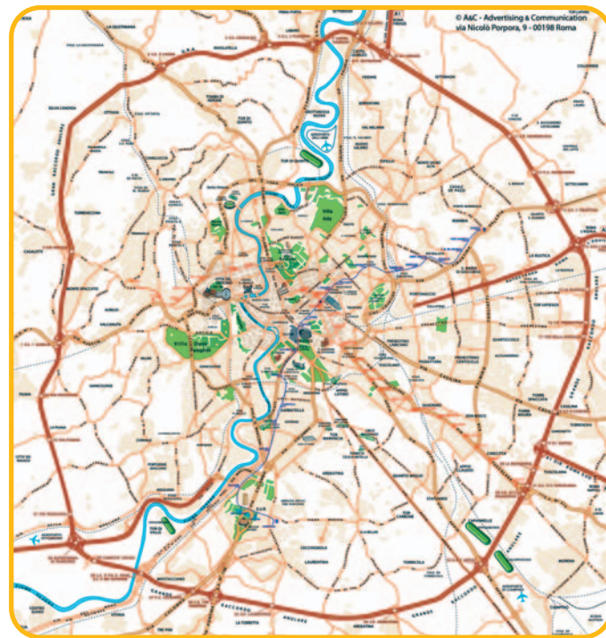
Mappa aggiornata del G.R.A.

Per chi arriva da nord , il modo migliore per raggiungere la Capitale è l'autostrada A1 Milano-Roma. Chi si muove dalla parte ovest del paese, invece, può prendere la Statale Aurelia e poi l'autostrada A12 Civitavecchia-Roma. Se si arriva dalla Costa Adriatica si prende l'autostrada A24 L'Aquila-Roma. Da Sud , infine, si prende l'autostrada A1 Napoli-Roma. Tutte le autostrade incrociano il Grande Raccordo Anulare su cui si trovano poi tutte le uscite per il centro e la periferia di Roma.